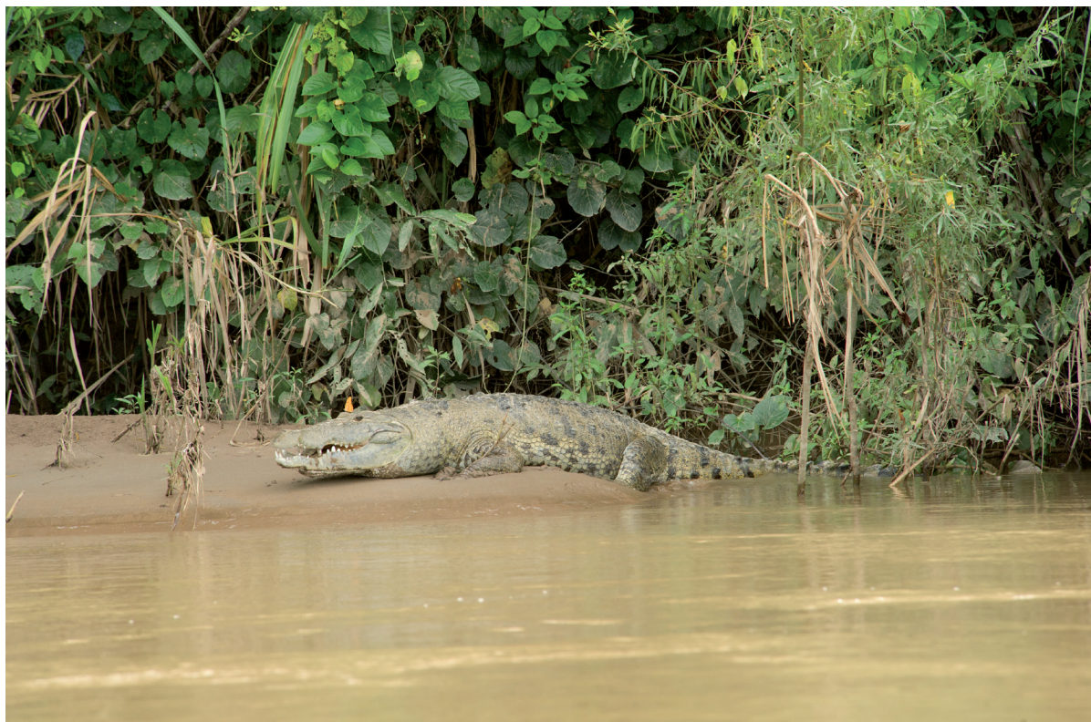
En las riberas del río Lacantún es frecuente observar al cocodrilo pardo. JME

se benefician y se convierten en los dueños de las empresas que surjan, la gente querrá participar activamente en esta actividad económica y conservará la selva que genera ingresos y empleos. Esto implica que los campesinos complementen su economía familiar como empresarios ecoturísticos y además se generen empleos directos e indirectos en la zona.