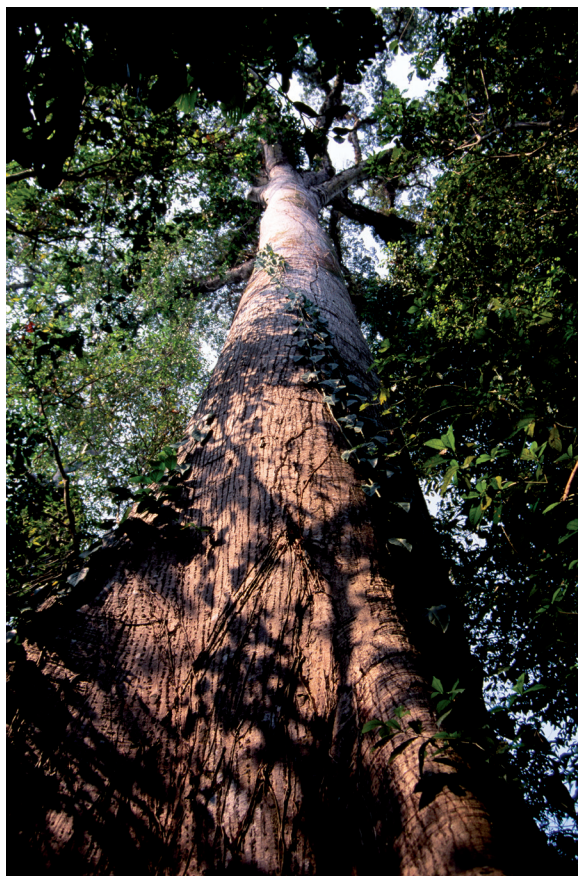
La ceiba, árbol más representativo de la región. Puede alcanzar 60 m de altura y una edad aproximada de 500 años. JME

do una sensación en el visitante de que la aventura empieza desde ese momento.