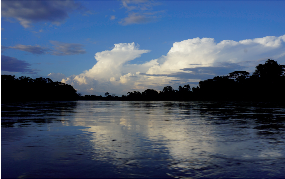
Atardecer en el Lacantún. GMB

6. El atractivo del ecoturismo son los ecosistemas naturales, no la infraestructura turística. Si bien todo servicio turístico requiere una infraestructura, en el ecoturismo ésta no es el atractivo, como sí lo son los ecosistemas naturales. La infraestructura debe entenderse como el conjunto de elementos o servicios indispensables para que los ecoturistas puedan trasladarse, hospedarse y realizar las actividades ecoturísticas de manera cómoda, pero dentro del concepto rústico e informal de estar aislados en medio de la naturaleza. Algunos ejemplos de dicha infraestructura son: cabañas de alojamiento, senderos interpretativos, señalización, salones de usos múltiples, restaurantes, museos, vías de comunicación, entre otros. Toda construcción debe establecerse de forma planeada, controlada y con el mayor uso posible de ecotecnias y energías renovables.