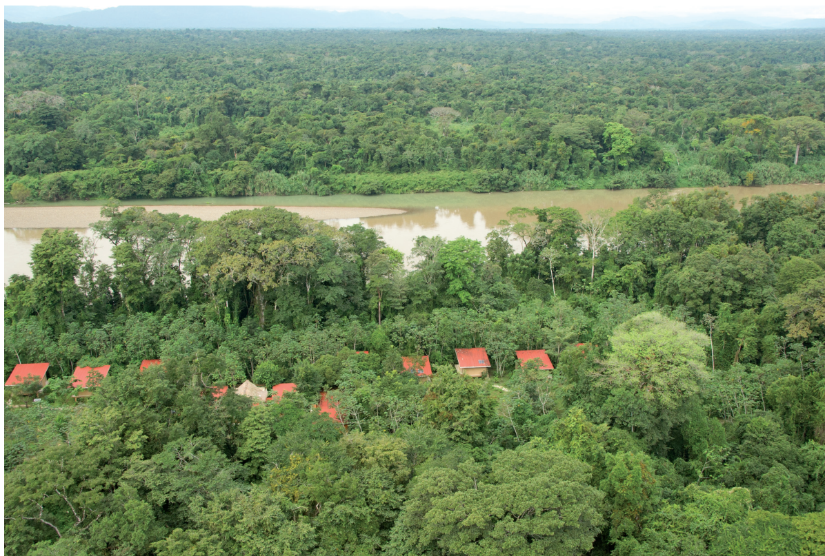
Vista aérea del Hotel Canto de la Selva, ubicado frente a la Reserva de la Biosfera Montes Azules. JME

Por otro lado, para que el desarrollo turístico tenga el mayor beneficio económico con el menor impacto ambiental es necesario que un número re-