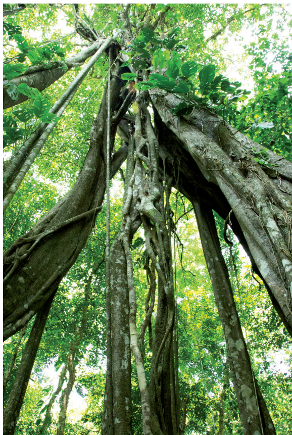
Al desarrollarse, los matapalos (amates) adquieren formas caprichosas. JME

limpieza, cocina y mantenimiento; promotores de información turística; recepcionistas; técnicos de equipos; mecánicos; vigilantes, entre otros.