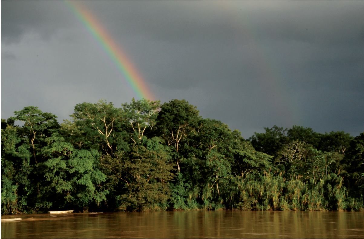
En la época de lluvias es frecuente observar estampas como ésta.