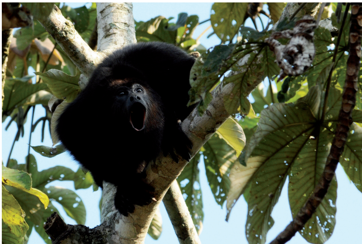
Un característico sonido de la selva es el rugido del saraguato. JME

que se interesaron y organizaron, y que son los dueños de fragmentos de selva de alta importancia por su biodiversidad y función de conectividad biológica.