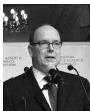
S.A.S. el Príncipe Alberto II de Mónaco

nuestra responsabilidad legar a las nuevas generaciones el poder vivir en un mundo sostenible”.